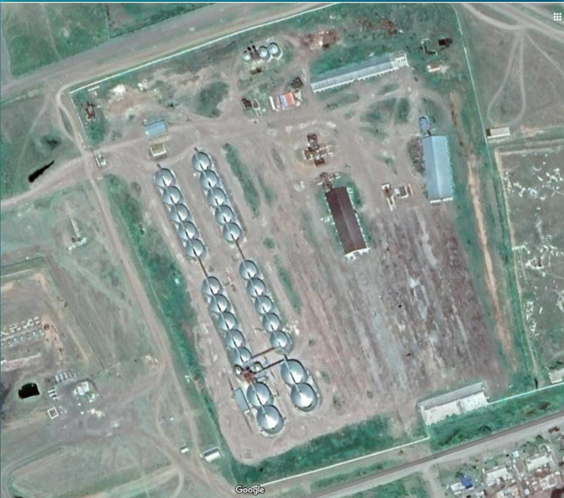
• Фото 2