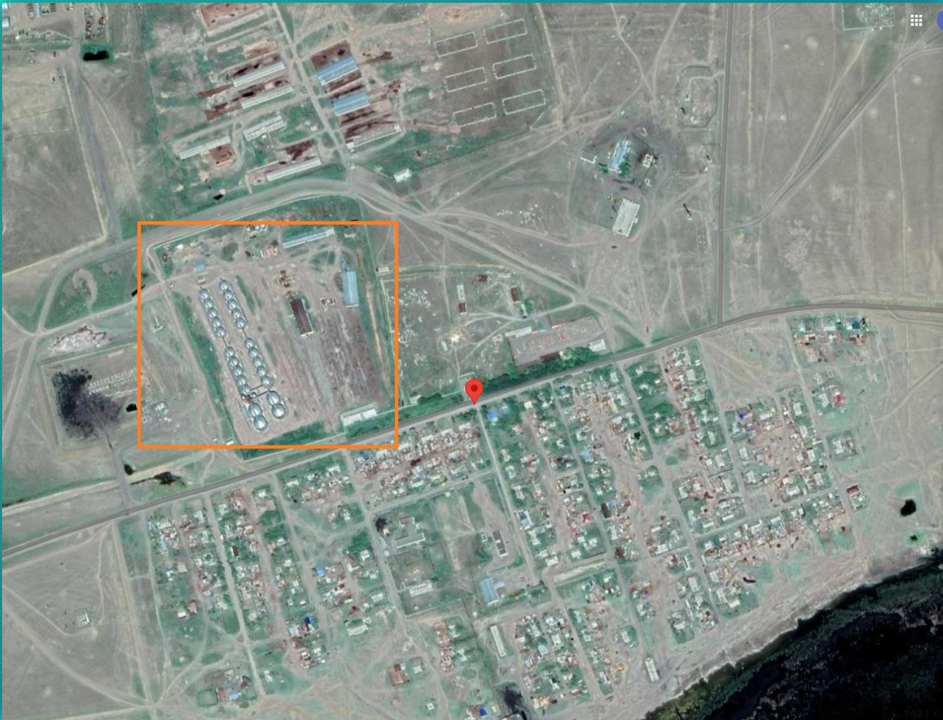
• село Бауманское